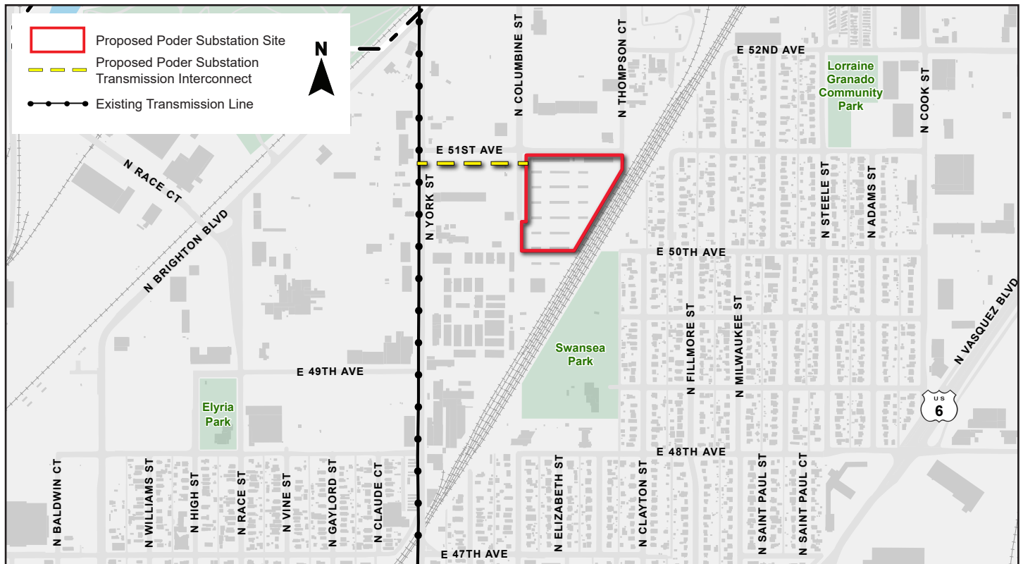
This map is a graphic and may not show exact locations

Construction is expected to begin in late 2024 and is anticipated to be completed in 2026, pending permit approvals.